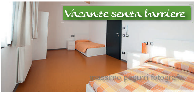
Vacanze senza barriere